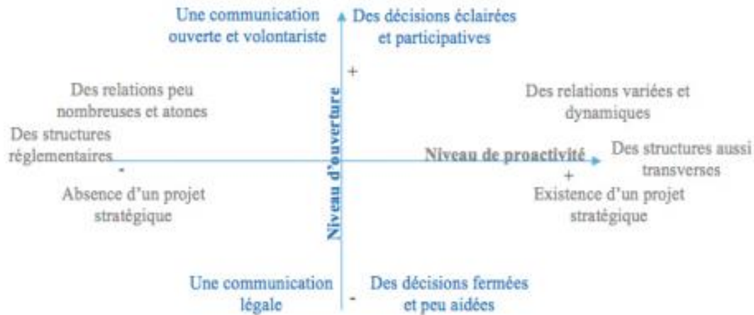
Figure 3 : La grille de lecture de la gouvernance intercommunale